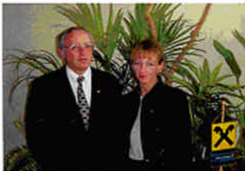
Dir. Herbert Haghofer